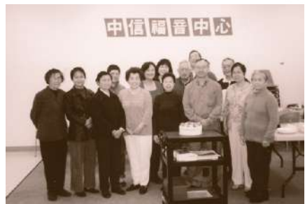
早期茶座聚會留影

福音茶座是中信初期最成功的事工之一。三十年來，它在華埠發展壯大，成為社區民衆重要的聚會和交流平台。許多人首次通過茶座聽到福音的信息，並在此過程中帶領衆多的人進入教會。