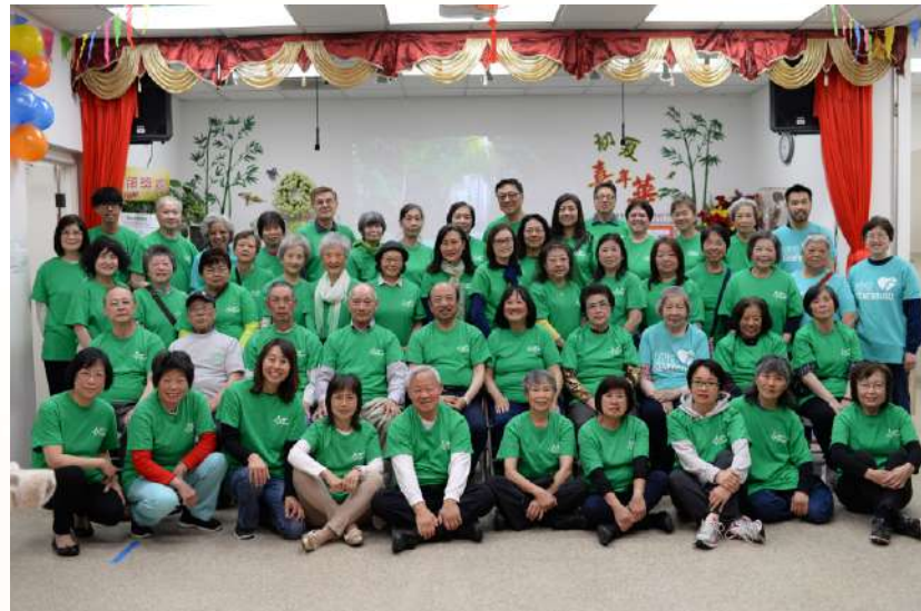
中信同學參加中信舉辦的佈道會