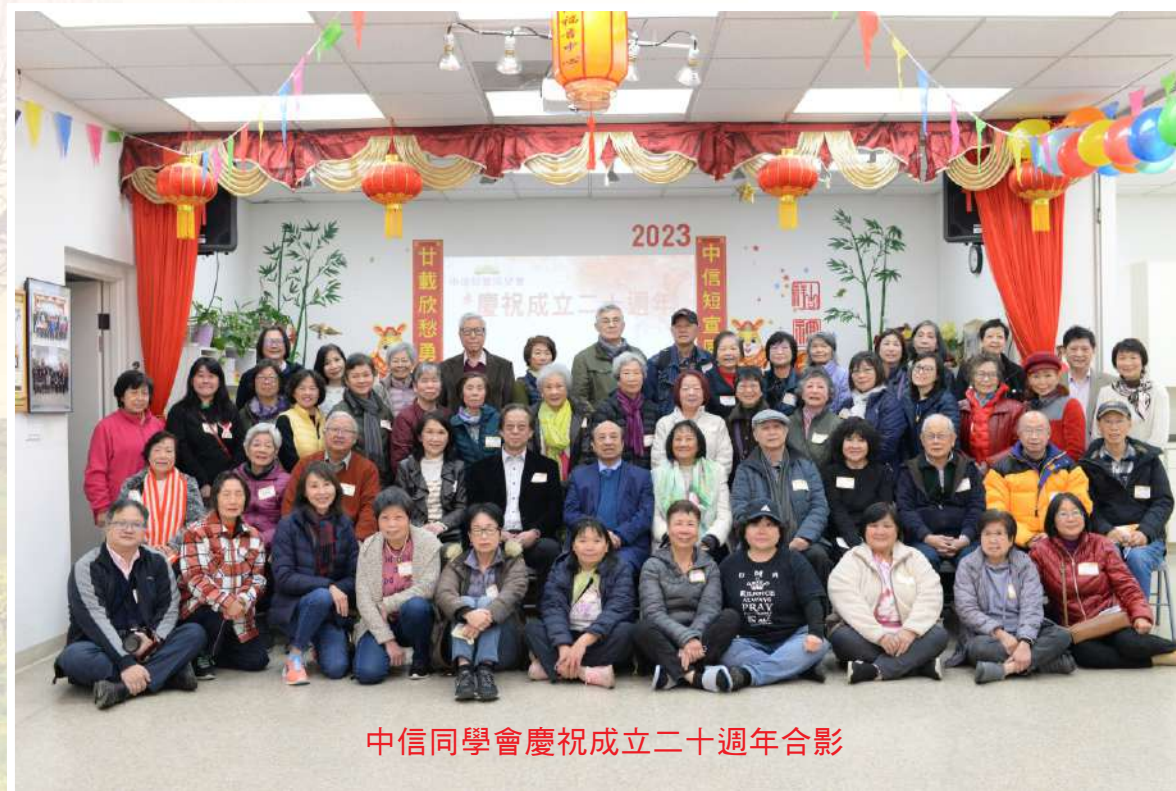
中信同學會慶祝成立二十週年合影