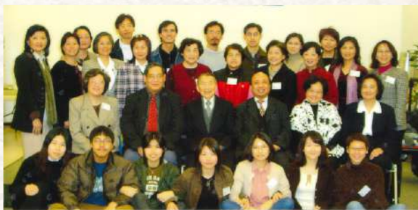
第九屆中信短宣訓練班 1/11/2003 - 4/12/2003

三藩市福音中心在過去30年，經歷著華埠的持續轉變，毫無疑問也必須不斷作出更新與調整。雖然現時很多人對三藩市及唐人街長遠的生活、營商及福音事工環境不能抱一個樂觀態度，但相信在華埠還有很多福音機會，很多拯救人靈魂的工作還需神忠心的僕人去承擔。就如以往一樣，福音中心仍然需要勇往直前，回應神的呼召，透過神賜下的屬天智慧，明白及願意不斷更新，用最有效