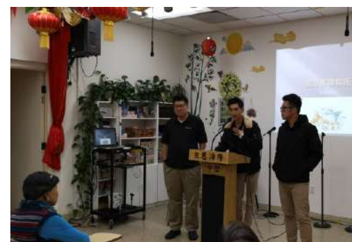
華人組織講解生前信託

展望未來，福音茶座將繼續發展，吸引更多的人參與，成為更多人認識福音和建立友誼的地方。無論未來如何變化，福音茶座都將繼續在華埠發揮其重要的作用，成為信仰和友誼的燈塔，照亮更多的人生道路。