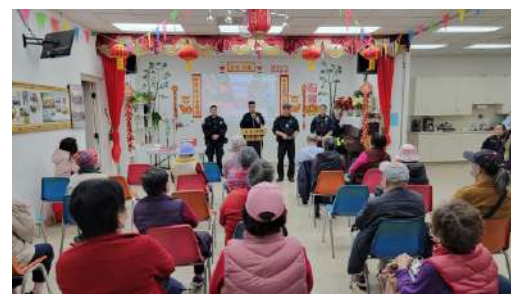
警局警官講解社區安全知識