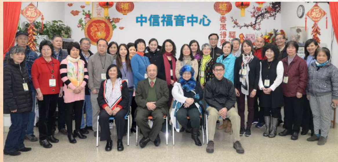
第二十五屆實用個人佈道/短宣訓練課程 2019年1/19 - 4/20