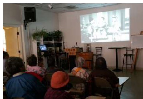
福音茶座：懷舊電影

隨著時間的推移，福音茶座的形式越來越多樣化。除了傳統的茶會形式，還加入了各種不同主題的講座和活動。一些講座甚至吸引了近百人參加。這些多樣化的活動不僅豐富了參加者的信仰生活，也讓更多人有機會接觸到福音的訊息。