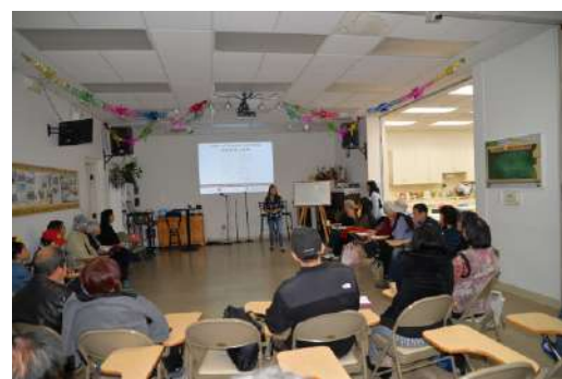
華人組織講解賭博的危害