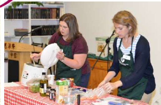
Food Bank 員工烹飪示範