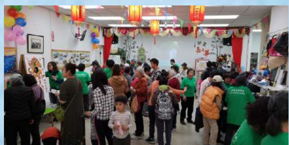
訓練班同學宣教實習

課程不僅增進了我們對聖經的理解，更讓我們在信仰上得到實質的成長與豐盛。幫助我們更親近神，愛主更深，並活出基督的樣式。