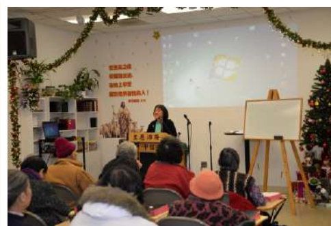
胡范綺芳師母主持福音茶座