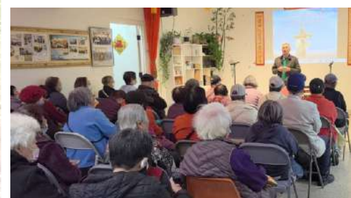
江始光弟兄福音茶座分享