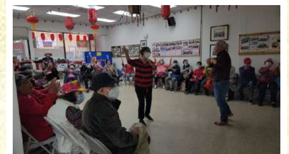
歡樂天地福音茶座