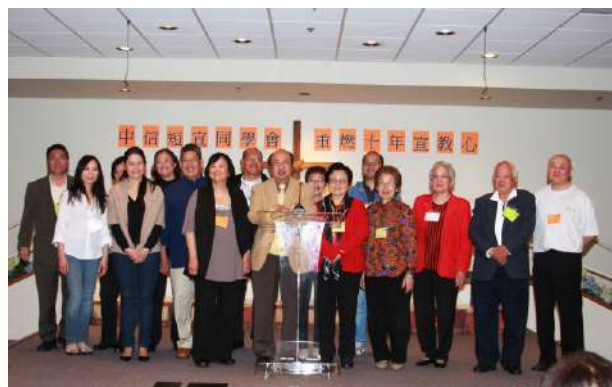
2012年中信同學會慶祝成立十週年

每年，同學會都組織短宣隊，前往國內外不同城市宣教。一方面，這是回應主耶穌基督對信徒的宣教大使命；另一方面，這也讓同學們親身體驗帶人信主的內心喜樂。