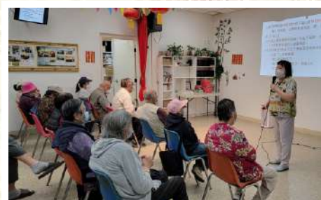
連心橋宣教士福音信息分享